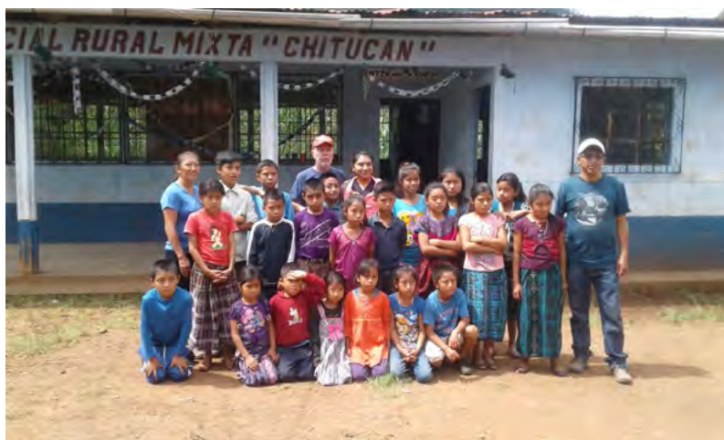
Alumnos y maestros de la escuela de Chitucán con personal del Ecap, 2019

En el año 1995 se solicitó la construcción de una escuela por medio de la Municipalidad de Rabinal, pero no se logró su aprobación, lo cual generó molestias en la población, ya que se pensó que la alcaldía no había hecho mayor esfuerzo por lograrlo. Entonces, la comunidad empezó a tocar puertas en otras instituciones y fueron nuevamente a la Pastoral de Alta Verapaz, donde nos brindaron hierro, láminas, block, cemento, que fueron llevados en lancha por el embalse del río Salamá, caminando hora y media para acarrear los materiales en bestias hasta la comunidad.