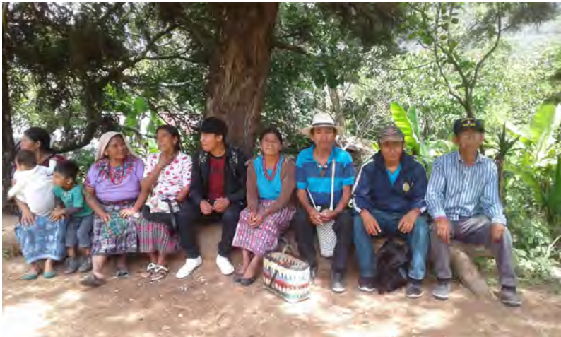
Reunión para la toma de Acuerdos Comunitarios, 2019

Durante el mes de octubre de 2019, a requerimiento del COCODE local, fuimos invitados a dos reuniones que tuvieron lugar en Chitucán, a las que les denominaron ACUERDOS COMUNITARIOS. La invitación fue por el trabajo de acompañamiento que hicimos durante el tiempo que ellas y ellos estuvieron recordando y contando su historia. Los acuerdos de Chitucán fueron: