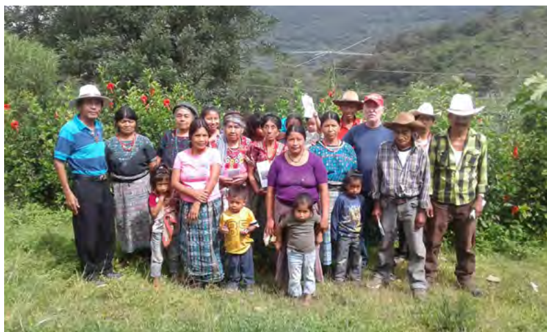
Reunión con parte de la población de Chitucán, noviembre 2019